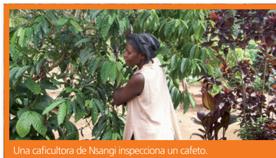
Una caficultora de Nsangi inspecciona un cafeto.

Unión de Cooperativas de Cafetaleros de R.L. (UCAFES) es una unión de cooperativas de productores/exportadores cafeteros privados de El Salvador. La integran 16 miembros que producen 400.000 sacos