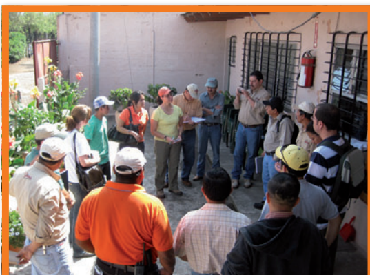
Participantes en un taller de capacitación para capacitadores que tuvo lugar del 2 al 4 de marzo de 2010 en Guatemala.