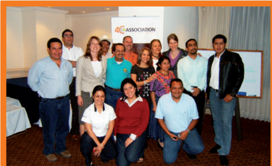
Al taller regional asistieron más de 40 miembros de 4C, asociados y otras partes interesadas de América Latina, los Estados Unidos y Europa.

Como anticipo de la Conferencia Mundial del Café de 2010, la Asociación 4C organizó el primer Foro de Sostenibilidad en Guatemala que tuvo lugar el 24 de febrero. El Foro ofreció a los participantes la oportunidad de analizar el tema de la producción sostenible de café en la región, así como de poner en común lo aprendido y las prácticas óptimas.