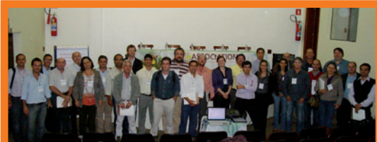
En el Foro de la Sostenibilidad en Brasil, las diferentes partes interesadas discutieron el futuro de la sostenibilidad en Brasil

La Asociación 4C organizó su primer Foro de Sostenibilidad en Brasil, que reunió a diversos participantes del sector cafetero brasileño para intercambiar experiencias y definir en común la orientación estratégica futura de la Asociación 4C en el país.