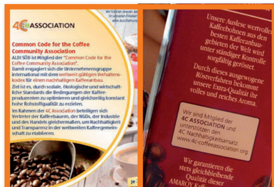
Izquierda, el folleto informativo de Aldi Süd derecha, la Declaración de los miembros de 4C en la etiqueta de su marca Amaro.

Como miembro perteneciente al sector de comercio e industria, Aldi Süd también incluyó la Declaración de los miembros de 4C actualizada en la etiqueta de su marca Amaro. La declaración de los miembros refleja el compromiso de Aldi Süd de esforzarse por mejorar la sostenibilidad en todo el sector del café participando en la Asociación 4C.